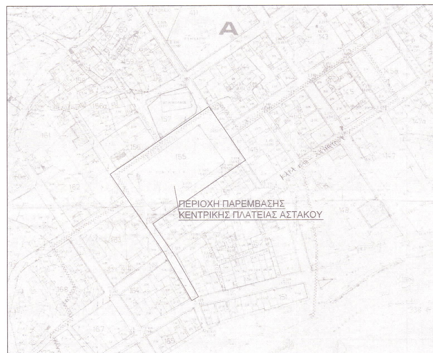
ΑΠΟΣΠΑΣΜΑ ΡΥΜΟΤΟΜΙΚΟΥ ΣΧΕΔΙΟΥ ΑΣΤΑΚΟΥ

* Η ΠΕΡΙΟΧΗ ΠΑΡΕΜΒΑΣΗΣ ΒΡΙΣΚΕΤΑΙ ΕΝΤΟΣ ΤΟΥ ΙΣΤΟΡΙΚΟΥ ΤΟΠΟΥ ΤΟΥ ΑΣΤΑΚΟΥ ΟΠΩΣ ΑΥΤΟΣ ΟΡΙΖΕΤΑΙ ΜΕ ΤΟ ΦΕΚ Β 636/18-7-1995